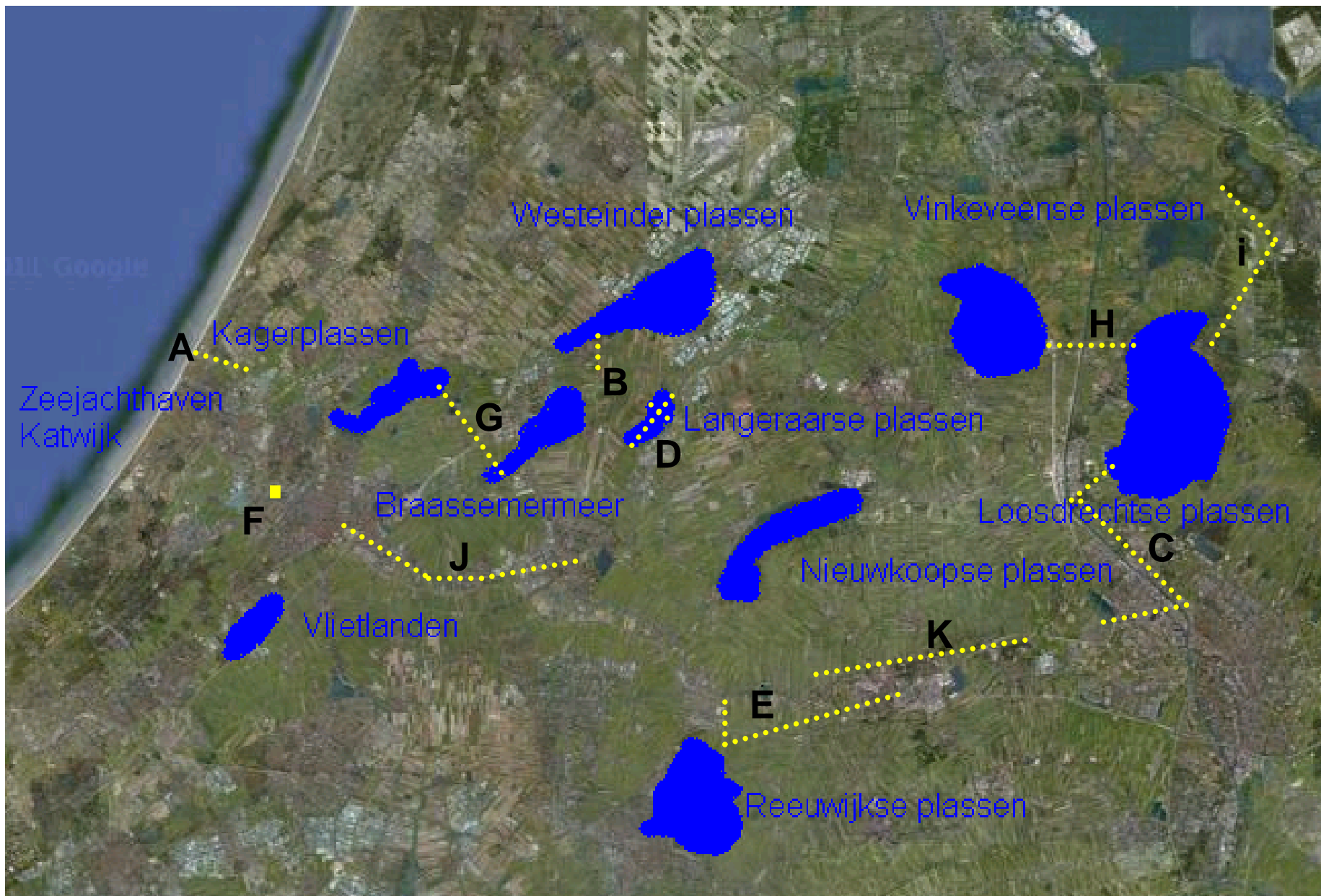
Indicatieve kaartweergave infrastructurele projecten (L t/m P niet in kaart weergegeven)