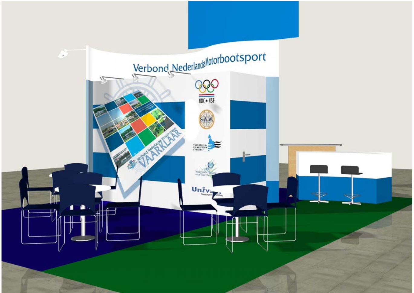
Artist impression van de vernieuwde Hiswa-stand van de KNMC en het Verbond Nederlandse Motorbootsport

KNMC, Dukatenburg 90-11/6, 3437 AE Nieuwegein www.knmc.nl