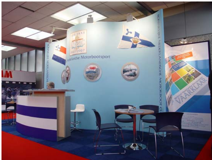
Nog een foto van de stand

organisatie die hiervoor opgetuigd dient te worden niet opweegt tegen een voordeel voor de verenigingen om hun leden een pasje te geven, met daarmee de mogelijkheid te creëren om kortingen te krijgen. Ook de verwerking van mutaties zal een administratieve zorg blijven. Dus geen ledenpasjes.