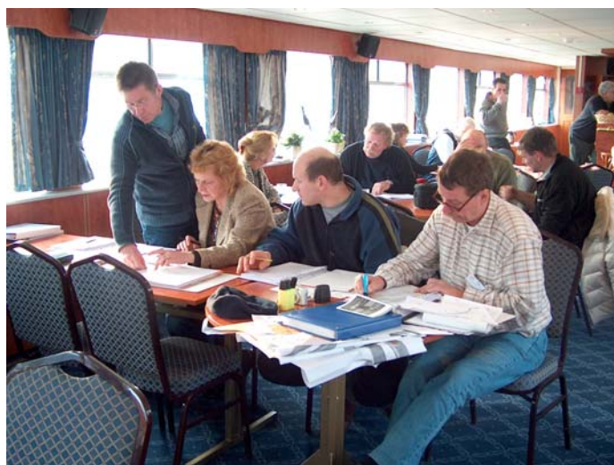
De meeste cursussen van de S.A.W. worden aan boord gegeven. Zo kun je tijdens de lessen ook praktijkvoorbeelden laten zien.

Het Verbond voor de Nederlandse Motorbootsport zal zich in hoofdzaak toeleggen op de dienstverlening aan verenigingen en vertegenwoordiging in belangenorganisaties en overheden.